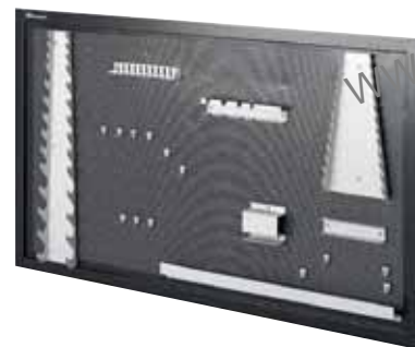
Ref.: ELITE T 2.15

Tablero porta herramientas con soportes especiales fijación a banco. Dimensión: 1.500 x 750 x 20 mm.