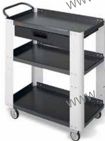
Ref.: ELITE C 35

Carro de taller con cajón. Dimensiones 850 x 450 x 910 mm