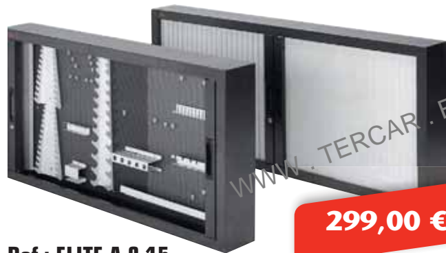
Ref.: ELITE A 2.15

Armario porta herramientas con soportes especiales fijación a banco. Dimensión: 1.500 x 750 x 190 mm.