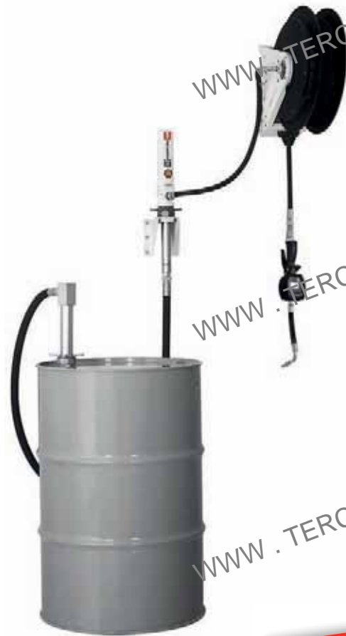
Ref.: ELITE S3B-M

Sistema neumático para aceite con enrollador y contador, para bidón de 205 l o contenedor de 1.000 l.