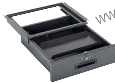
Ref.: ELITE C 2.15