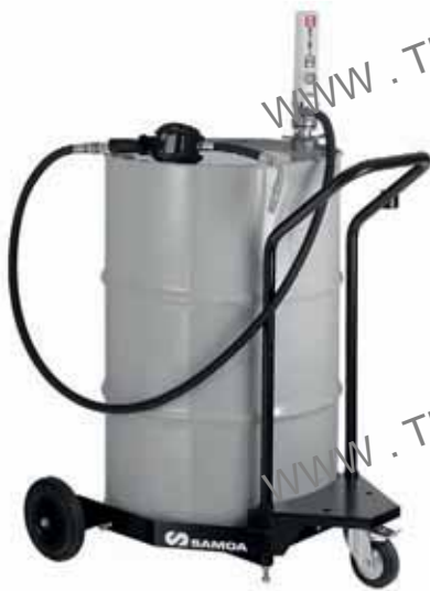
Ref.: ELITE DAM2

Dispensador neumático de aceite con contador, para bidón de 205 l.