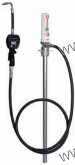
Ref.: ELITE BNA2

Bomba neumática de aceite con contador, para bidón de 205 l.